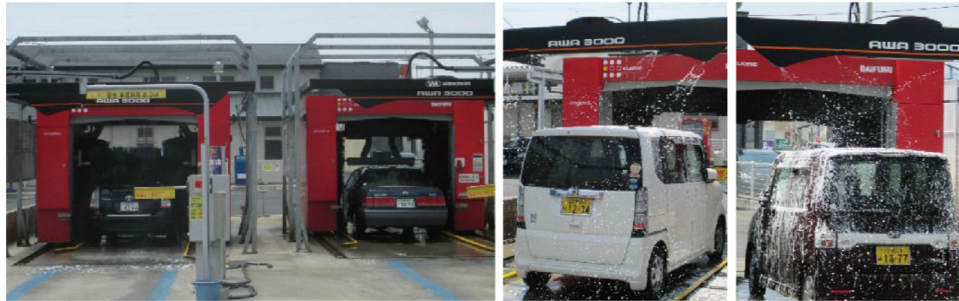
2基並ぶ洗車機はどちらもAWA3000仕様。一台稼動すると見える洗車効果で選択比率アップ

(株)ナカハタ様は以前より行橋市でセルフSSを出店したい、という熱い思いを持っておられました。長年土地を探し求めた末に念願がかなった出店となりました。洗車機については2台設置を希望され、メーカー及び機種について