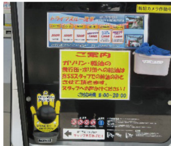
計量機にも洗車メニューを掲示して認知を高めている。

メニュー告知は明快にしてお客様にわかりやすく、という工夫がされており、現在では全洗車台数に対する「泡コース」の比率は、常時80%を超え、洗車単価に貢献しています。