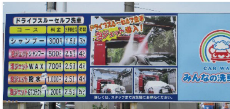
80%以上のお客様が泡コースを選択

メニュー告知は明快にしてお客様にわかりやすく、という工夫がされており、現在では全洗車台数に対する「泡コース」の比率は、常時80%を超え、洗車単価に貢献しています。